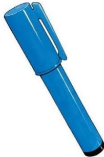
a pen [pen]