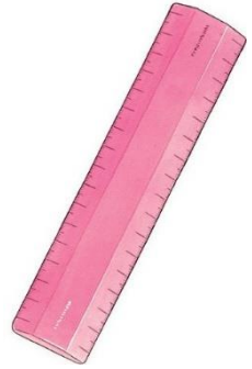
a ruler [rulə]