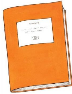
a book [buk]