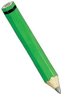
a pencil [pensl]