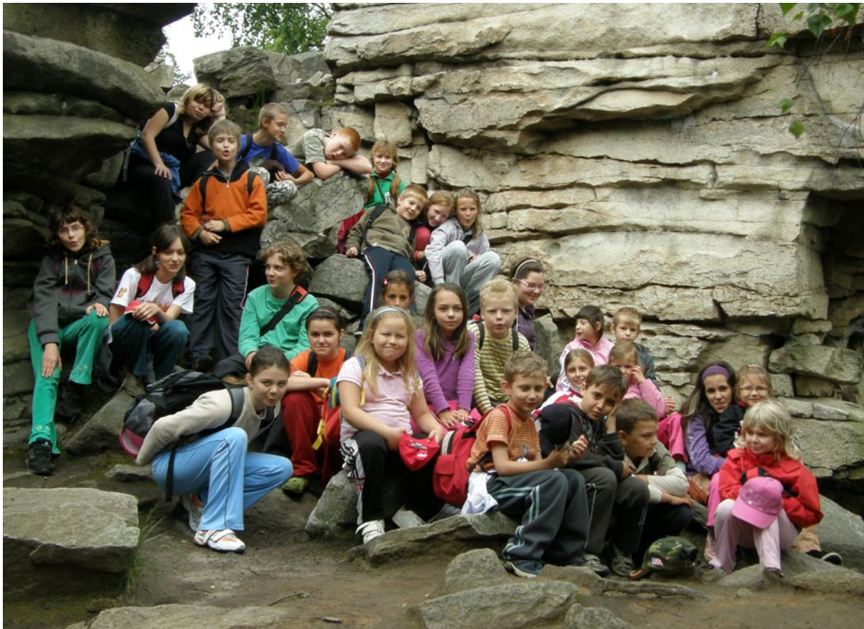
Společná výprava ke skalám