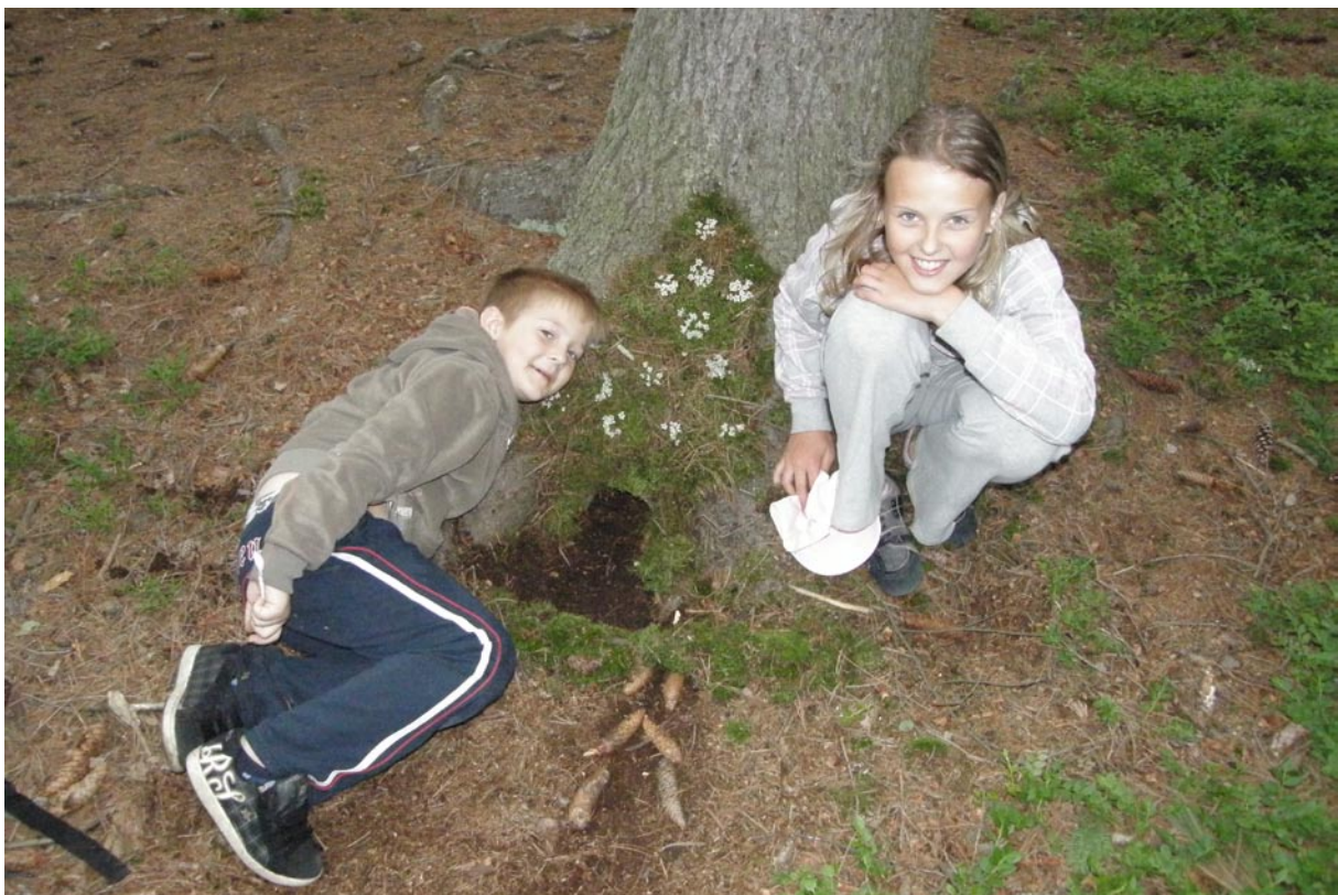
Zahrádka pro pidilidi